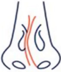
انحراف الحاجز الأنفي

إن انحراف الوتيرة الأنفية يعني اعوجاج الحاجز الأنفي الذي يقسم الأنف إلى شقين الشق الأيمن والشق الأيسر وبالتالي تضيق أحد الشقين أو كلاهما.