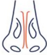
الحاجز الأنفي طبيعي